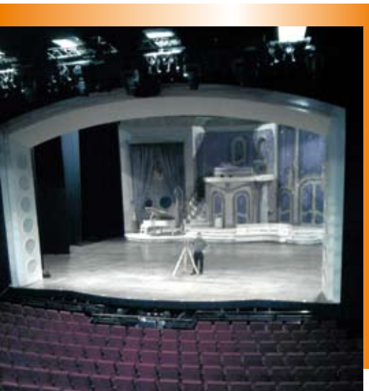
Michael Ehlers vermisst die Bühne des Hamburger Operettenhauses mithilfe einer Totalstation.

Umbau passgenaue Bauteile vor, die schnell auf- und abzubauen waren.