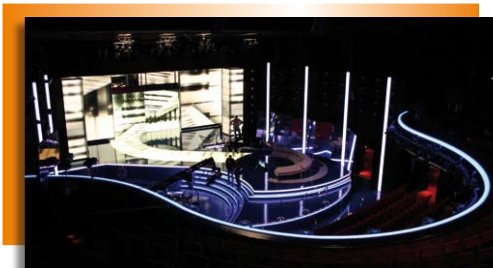
Neuer Look für den TV-Event – die umgestaltete Bühne des Hamburger Operettenhauses.